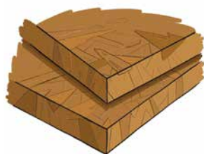
a. Valorisation matière Panneaux de particules (0/50)