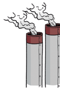
b. Valorisation énergétique Utilisation en chaufferie