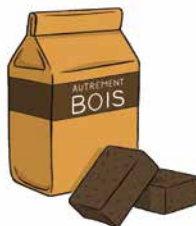
b. Valorisation énergétique Fabrication de briquettes de chauffage