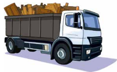
c. Transport vers l'éco-parc de Blaringhem ou l'éco-site le plus proche de chez vous.