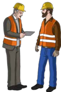
a. Étude de vos besoins