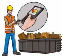
a. Réception et contrôle qualité