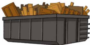
b. Mise à disposition de contenants (petits volumes – gros volumes : bennes / compacteurs...) et définition du rythme des collectes