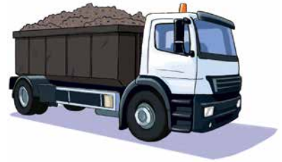
c. Transport vers l'Eco-Parc de Blaringhem ou l'éco-site le plus proche de chez vous