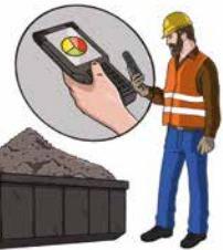
Réception et contrôle conformité de la matière entrante