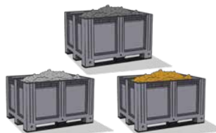
Ferrailles / Métaux / Plastique trié et prêt à être réinjecté dans un process industriel