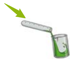
Traitement physico chimique