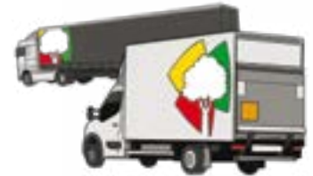
d. Collecte et transport vers les plateformes