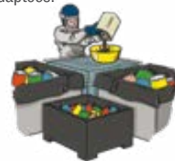
c. Tri et reconditionnement / Mise en sécurité en cellules de stockage dédiées