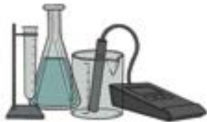
a. Contrôle / Analyse

Tri rigoureux des matières par des techniciens chimistes spécialisés, en vue de l'optimisation de la valorisation des déchets dans des filières adaptées.