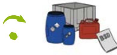
c. Mise à disposition de contenants adaptés et homologués