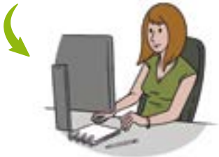
b. Gestion administrative entrante : procédure d'acceptation et édition de BSD (Track déchets)