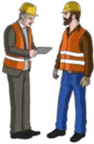
a. Étude de vos besoins