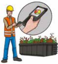
a. Réception et contrôle qualité de la composition de la matière entrante