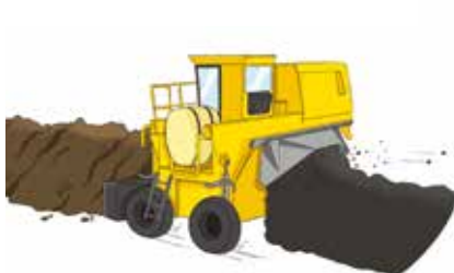
a. Retournement des andains et arrosage régulier