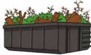
b. Mise à disposition de contenants (petits volumes – gros volumes : bennes / compacteurs ...) et définition du rythme des collectes