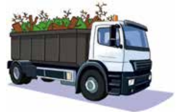
c. Transport vers l'éco-parc de Blaringhem ou l'éco-site le plus proche de chez vous