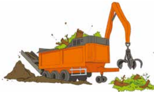
b. Broyage des déchets