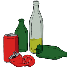
Biodéchets liquides emballés