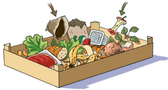
Biodéchets emballés ou non

Prise en charge des biodéchets solides et liquides